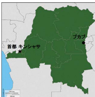
コンゴ民主共和国

監督：ティエリー・ミシェル／作者：コレット・ブラックマン、ティエリー・ミシェル／脚本：ティエリー・ミシェル、コレット・ブラックマン、クリスティーヌ・ピロ／ 編集：イドリス・ガベ／製作：ティエリー・ミシェル／2015 年／112 分／原題：L'HOMME QUI REPARE LES FEMMES／字幕：八角幸雄／監修：米川正子 後援：特定非営利活動法人アフリカ日本協議会、公益社団法人アムネスティ・インターナショナル日本、女たちの戦争と平和資料館、日本アフリカ学会関東支部、 日本学生平和学プラットフォーム、ヒューマン・ライツ・ウォッチ、ビジネス・人権資料センター、認定 NPO 法人テラ・ルネッサンス、毎日新聞社 当映画上映会は、アフリカ協会、大竹財団と国連広報センターから資金協力をいただいています。 総括：コンゴの性暴力と紛争を考える会